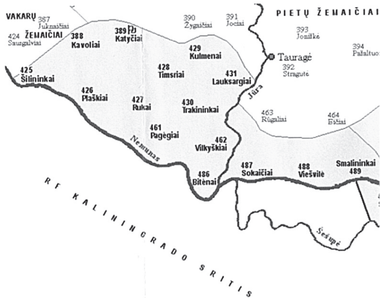
1 pav. Klaipėdos krašto aukštaičių plotas (naudotasi LKTCh žemėlapiu, įklijuotu tarp p. 35 ir 36).

LKTCh, VAK & KlpA leidiniuose paskelbtų tarmės tekstų 2 . Klaipėdos krašto aukštaičiai, savitas Prūsijos lietuvių tarmės tęsinys, priskiriami vakarų aukštaičių kauniškių patarimei. KlpA plotas, ribojamas Nemuno upės, rytuose prasideda nuo Smalininkų miestelio ir eina į vakarus iki Šilutės rajono pakraščio (žr. 1 pav.). Dėl kaimynystės su pietų ir vakarų žemaičiais turi žemaitiškų bruožų, dėl intensyvių kontaktų su vokiečiais – daug germanizmų. Šnekta yra labai apnykusi, vietinių gyventojų po Antrojo pasaulinio karo liko