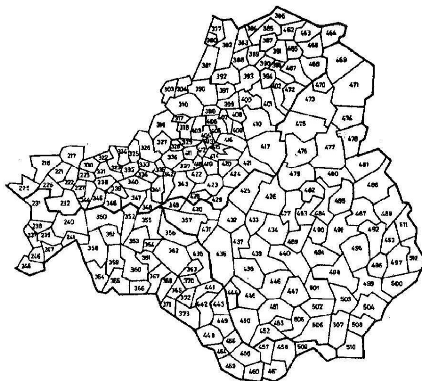
Карта № 2. Нумерация говоров восточной Латвии. Номера говоров западного варианта фонематической подсистемы глубоких говоров Латгалии расшифрованы в списке говоров этого варианта.